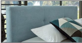
KT 1 mit 2-Punkt-Steppung