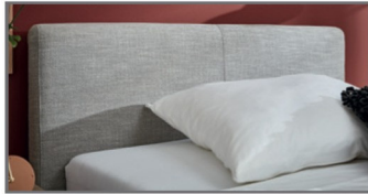
KT 2 glatt