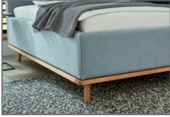
Holzrahmen massiv, eichefarbig