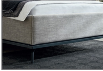
Holzrahmen massiv lackiert, Farbe graphit