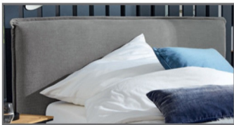
KT 3 mit umlaufender Biese